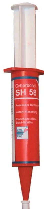
Seringue de 25 g